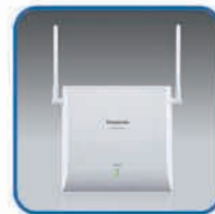
KX-NCP0158 IP-celstation (8 kanalen)

Het systeem schakelt automatisch om tussen de geïnstalleerde celstations, het bereik is groter en u blijft zelfs in grotere gebouwen mobiel bereikbaar.