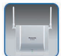
KX-TDA0158 Celstation (8 kanalen)