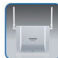
KX-TDA0156 Celstation (2 kanalen)