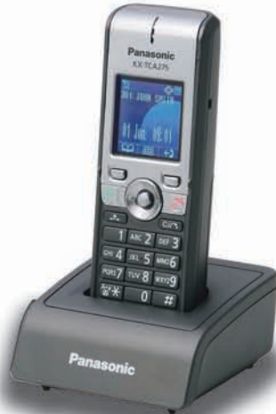
KX-TCA275 Compact Business Model