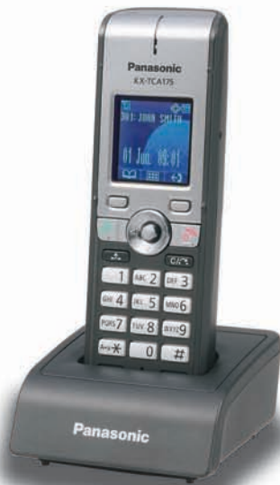
KX-TCA175 Standaard Model