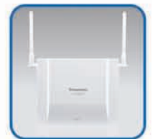
KX-TDA0155 Celstation (2 kanalen)