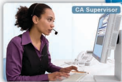
Telefoniste die Operator Console gebruikt