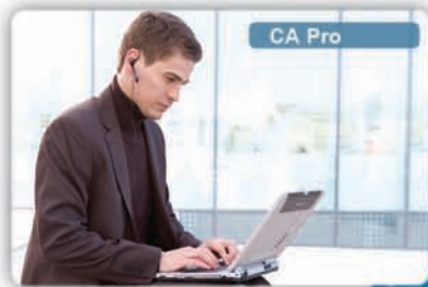
Thuiswerker die Softphone gebruikt