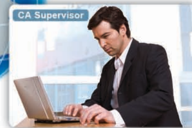
Supervisor die teamleden ondersteunt