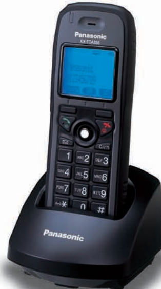
KX-TCA355 Tough Type Model