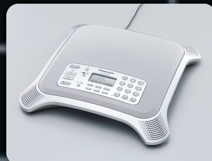
KX-NT700 IP Conferencesysteem

NCP500X en NCP500V worden standaard geleverd met wandbeugels.