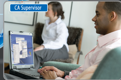
EEN COÖRDINATOR HELPT DE TEAMLEDEN

DANKZIJ COMMUNICATION ASSISTANT EN DE KX-NCP-SYSTEMEN KAN ELK BEDRIJF UNIFIED COMMUNICATIONS TOEPASSEN, WAARDOOR DE PRODUCTIVITEIT STIJGT.