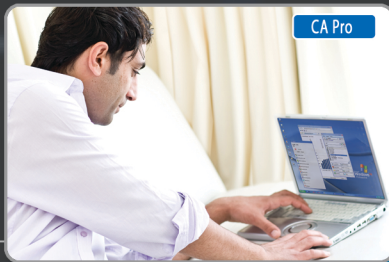
EEN TELEWERKER DIE SOFTPHONE GEBRUIKT