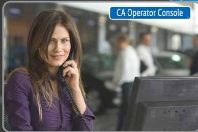
EEN RECEPTIONISTE DIE KLANTEN TE WOORD STAAT